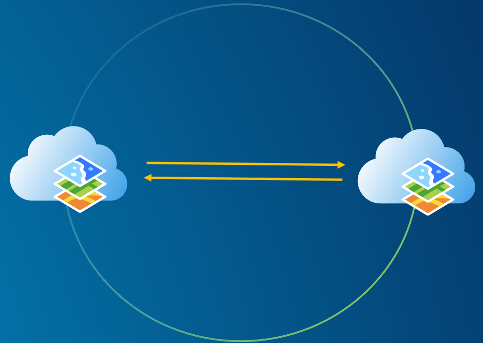
Portal to Portal osakondade vaheline koostöö