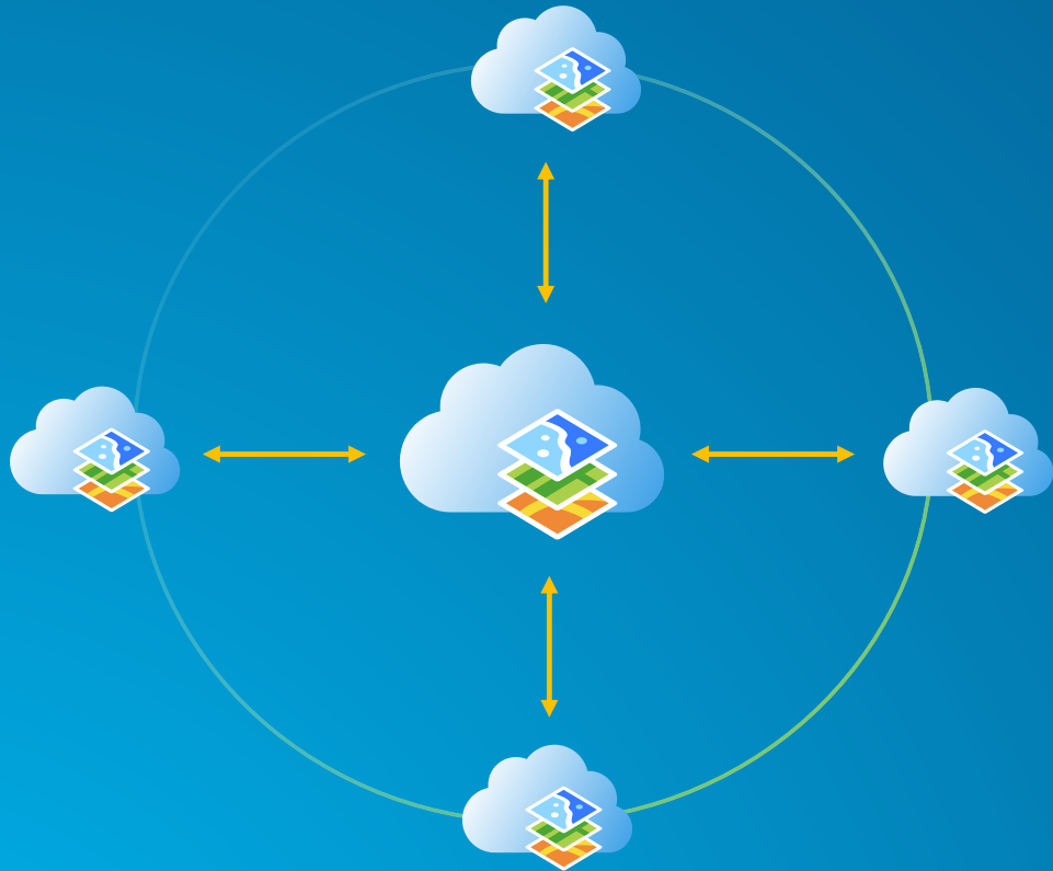
Portal to Portal keskne koostöö värav